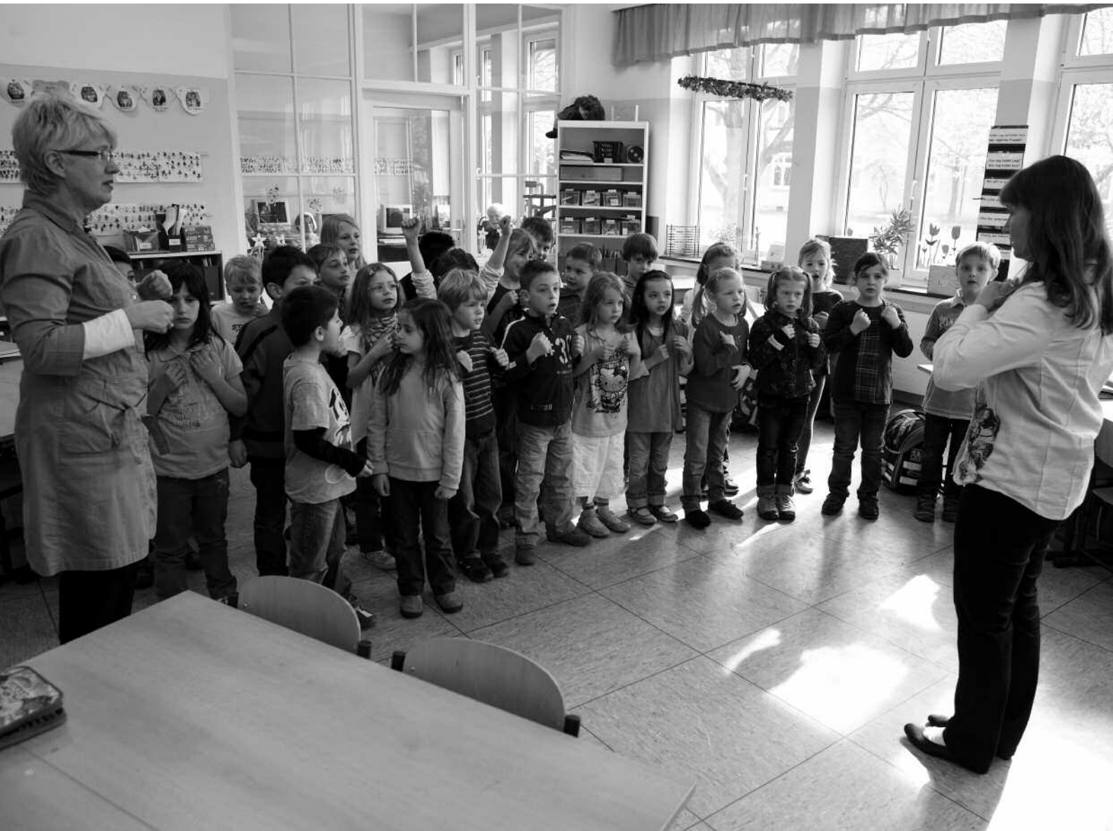
Musikunterricht im „Tandem“