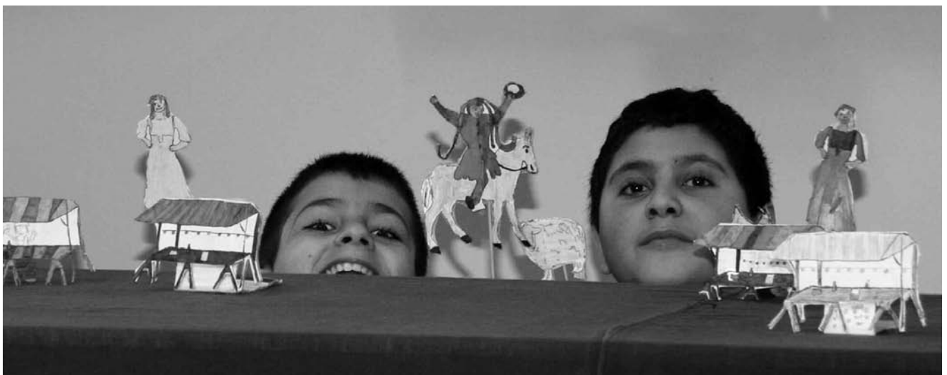
Schüler mit Stabpuppen bei der Realisation der Eulenspiegelszene.