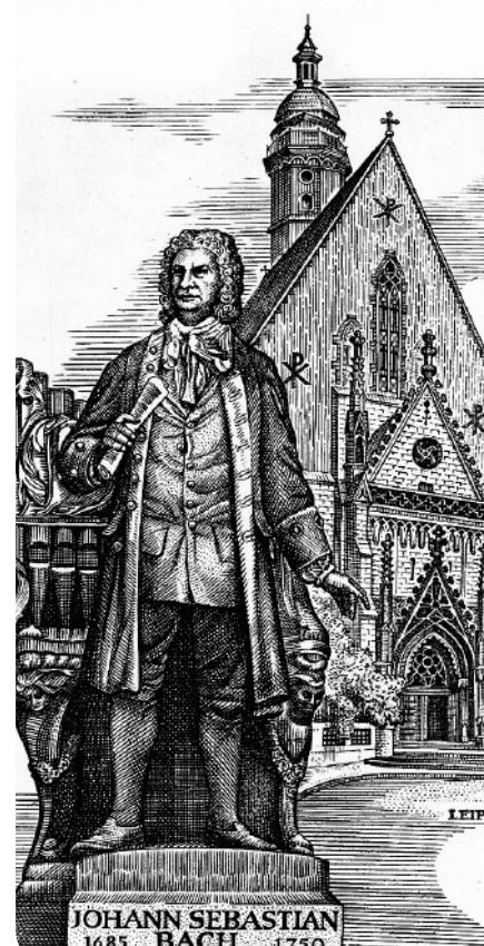
Staatsbibliothek Berlin, Preussischer Kulturbesitz

Es funktionieren hier auch andere Selbsterarbeitungsmethoden wie SOL (Selbstorganisiertes Lernen) oder Gruppenpuzzle. Und nun viel Spaß bei Bachs Lebensgeschichte.