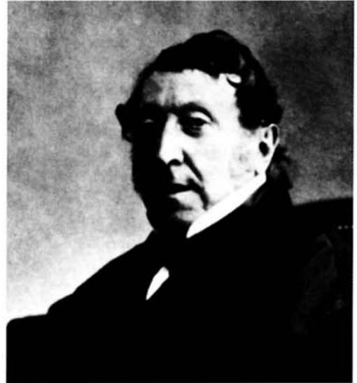
Gioacchino Rossini (1792-1868)

Umkreise die Dreiklangstöne in der Melodie!