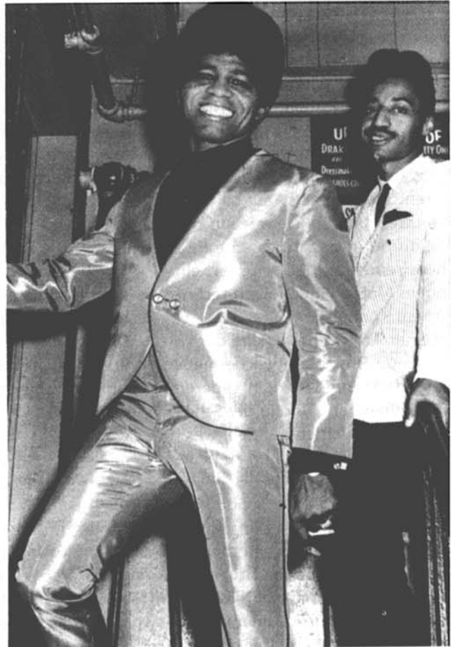
James Brown, „The Godfather of Soul“, in jungen Jahren

Samba- und Bossa-Nova-Rhythmen finden sich z. B. in der bei vielen SchülerInnen populären Musik des Dancefloor wieder. Häufig handelt es sich dabei um den Clave-Rhythmus oder um seine Variationen. Aber vor allem gehört Bossa Nova zu den Jazz-Standards, so daß eine Behandlung im Musikunterricht aus